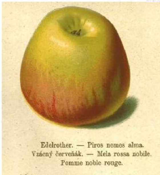
R.Stoll 1888 Pomologie.

ORIGINE : Tyrol du sud. Décrite en 1859 et cultivée en Wurtemberg puis à Angers chez A.Leroy dès 1868 et jusqu'en 1916 (plus en 1935). Conservée à Brogdale (the book of apples , 1993 , p.204 ).